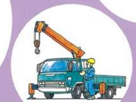
小型移動式クレーン(5t未満)の運転