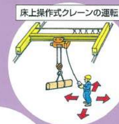
床上操作式クレーンの運転